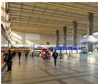
Rakousko: Westbahnhof – nádraží Wien